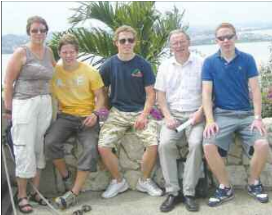
Familien i Guayaquil 18 år etter.