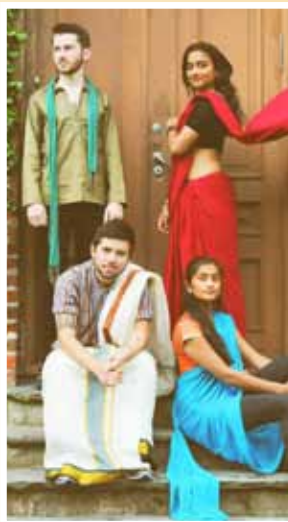
9 grader nord

Musikalske innslag ved gruppen «9 Grader Nord». Billetter: Kr 100,-