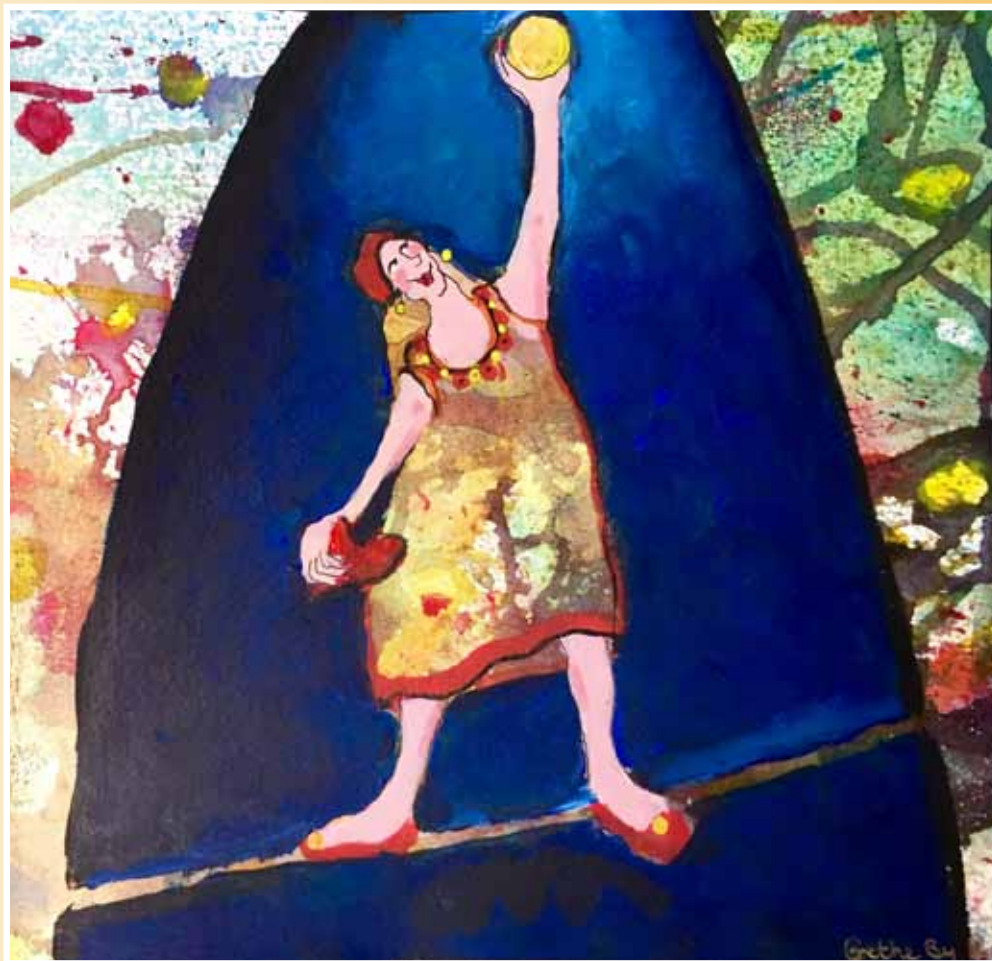
Grete By Rise