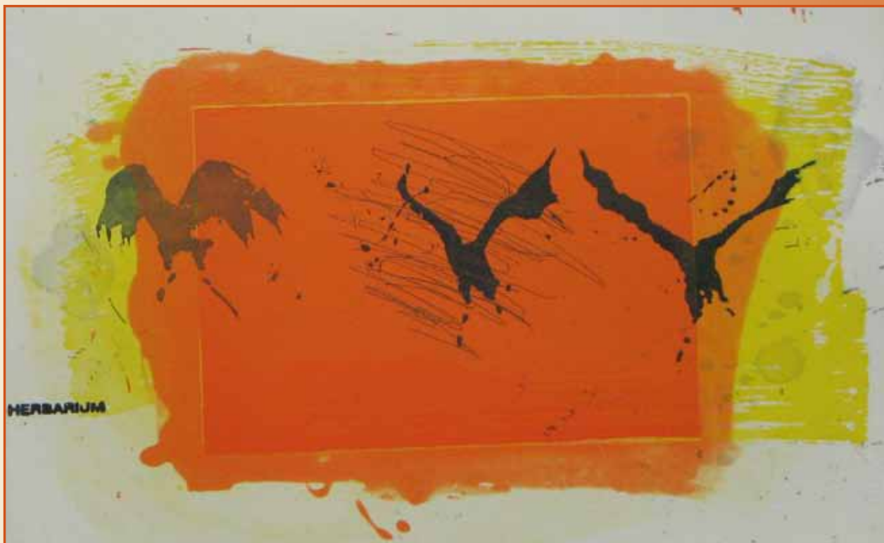
Kjell Nupen: Flygende herbarium