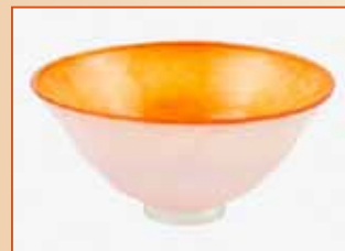
Glasshytten Varmt Glass

Kl 17.00 Kreativt program for fem-åringer med foreldre v/Tone Ekerhovd