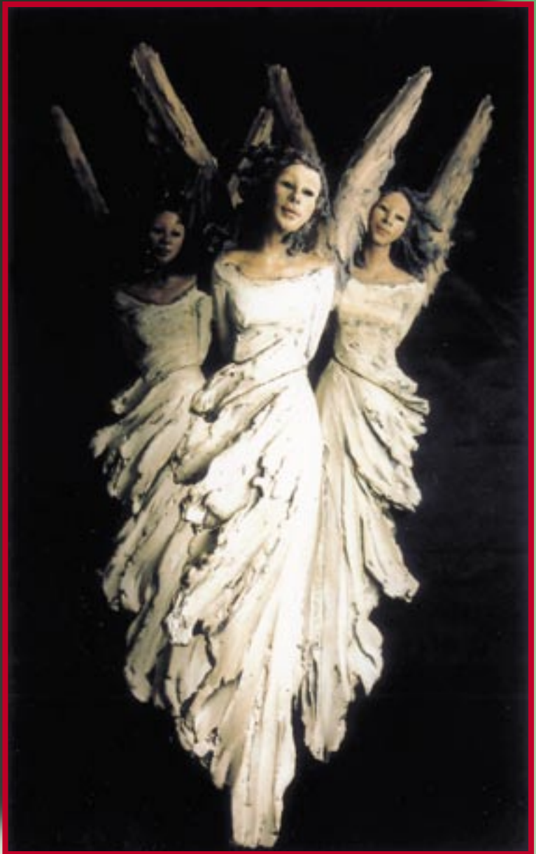
Ingunn Dahlin - "3 engler", steingods 2005